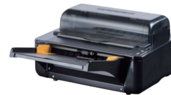
フルオートラミネーター (A3対応)