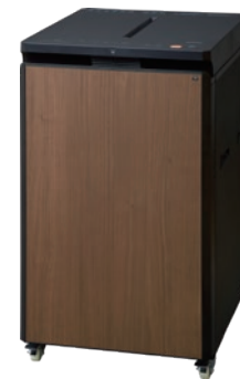
シュレッダー (オートフィード・A3対応)