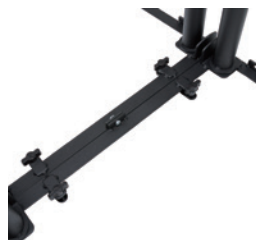
架台同士横連結可能(6箇所)