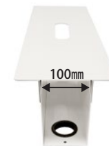
デスク間100mmで 取り付け可能