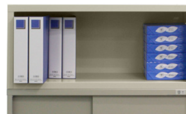
ちょっとした消耗品を収納できる