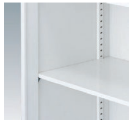
棚板は24mm間隔で調整可能