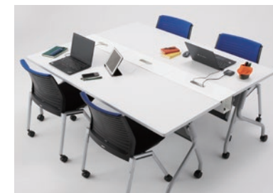
ミーティングテーブル