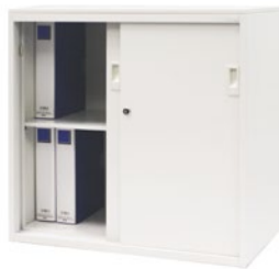
2段A4ファイル収納可能