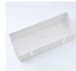
底面の穴で熱を逃がし、 火災を予防