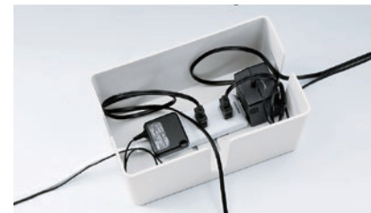
余ったケーブルもスッキリ収納