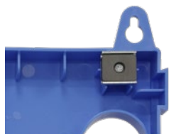
裏側2箇所マグネット付