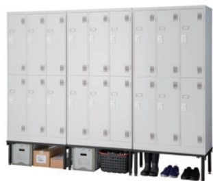
収納例：段ボール、工具箱、長靴、安全靴など