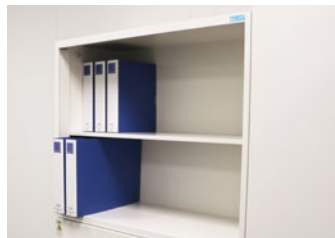
<収納例> 上段:A4ファイル 下段:A3ファイル