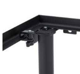
ロッカー固定留具付き(4箇所)