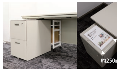
ワゴンの裏側に収納可能