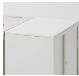
上部木製天板付き