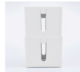
スタッキング可能