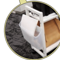
プラスチックボックス 使用イメージ