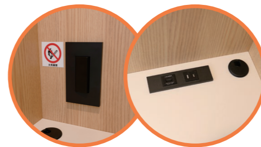
コンセント×3・USBポート×1