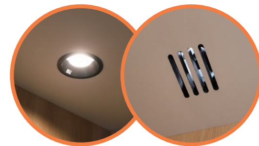
LEDダウンライト・換気扇