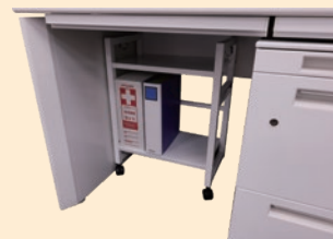
トレーワゴン (NRS-TWS) W450×D270×H613mm ※足元収納