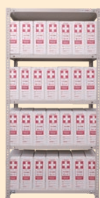
スチール棚奥深 (SR-1ANF) W875×D600×H1800mm ※1段×7個2列 (14個) 4段