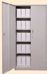
両開き書庫 (RS-8-3) W880×D380×H1790mm ※1段×7個5段