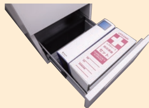
インワゴン W398×D581×H613mm 程度 ※各種ワゴンに対応可能