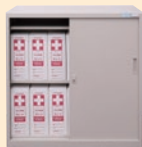
スチール書庫 (RS-8-1) W880×D400×H880mm ※1段×7個2段