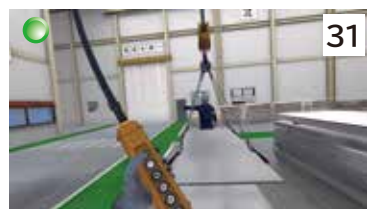
クレーン激突され