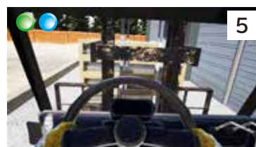
フォークリフトの転覆