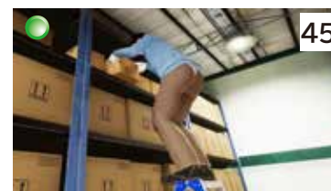
脚立からの墜落（棚荷下ろし）