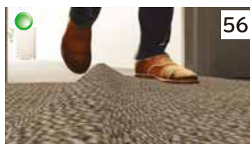
つまづきからの転倒（たるんだマット）