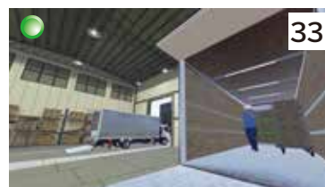
ロールボックスパレット激突され