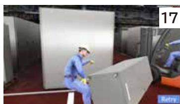
フォークリフトの荷崩れ