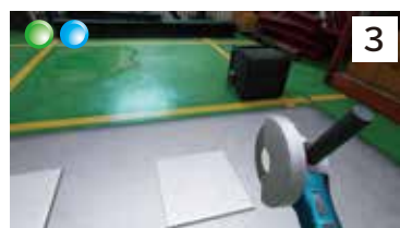
電動工具での感電