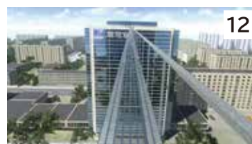
高所足場からの墜落