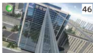
高所足場からの墜落