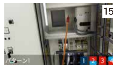
キュービクル点検作業