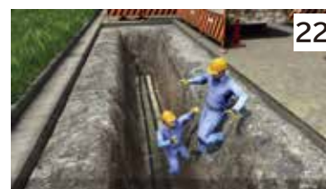
埋設配管作業中の法肩滑落