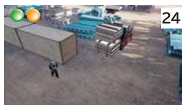
フォークリフトの過剰積載