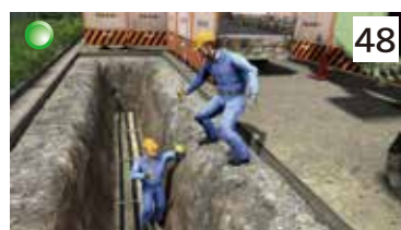
埋設配管作業中の法肩滑落