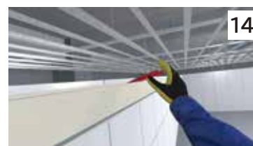
作業台使用中の転落