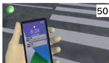
歩きスマホによる事故