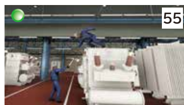
大型変圧器上作業の転落