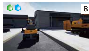
道路舗装作業での車両との衝突