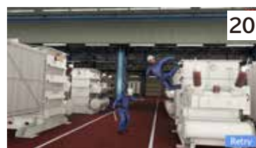
大型変圧器上作業の転落