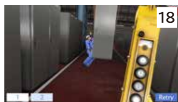
ホイスト操作中の接触事故