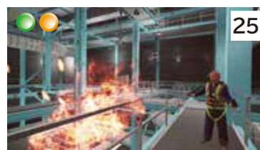
確認不足による火災