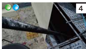
高所からの工具落下