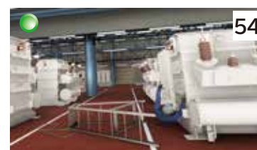
昇降台使用中の転落