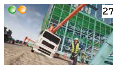
安全確認不足によるクレーン事故