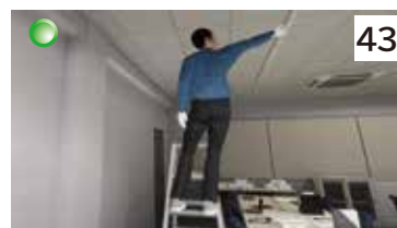
脚立からの墜落（蛍光灯交換）