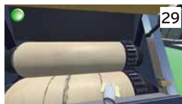
ロール機巻込まれ