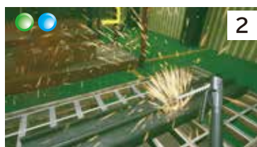
溶接作業での火災