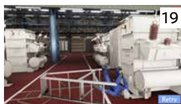
昇降台使用中の墜落