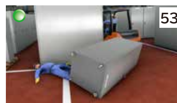
フォークリフトの荷崩れ