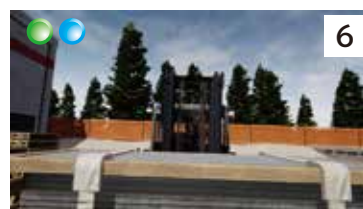
積載作業での挟まれ