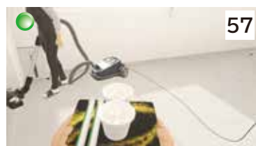
つまづきからの転倒（通路上のコード）