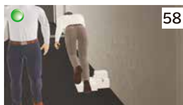
つまづきからの転倒（通路の荷物）