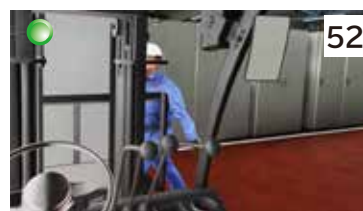
フォークリフトの触車事故