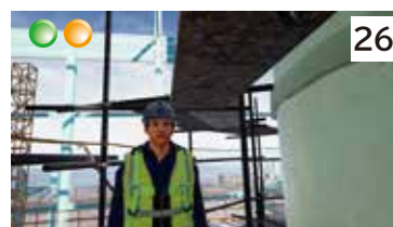
高所作業で不注意