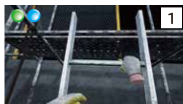
移動ハシゴからの墜落

● 3 軸 VR シミュレータ対応 ● 1 週間レンタル対応コンテンツ ● 操作不要コンテンツ