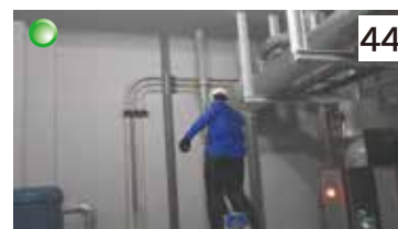
脚立からの墜落（配管レバー締め）