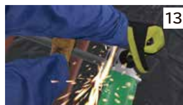
グラインダー使用中の火傷