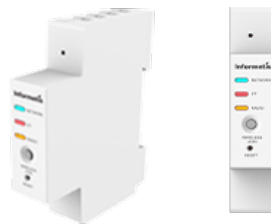
サーキットメーターCM-2/J

「そらフラット」に標準装備される電力計測用センサーは、インフォメティス社のデバイス、サーキットメーターCM-2/Jを採用。センサーで計測された電力データは同社のクラウド環境にアップロードされ、コユューレンティアの Rentia Cloud と API 連携しデータの共有を行います。収集した電力データを活用することで、建設現場事務所におけるエネルギーマネジメントサービスの可能性を今後検討してまいります。